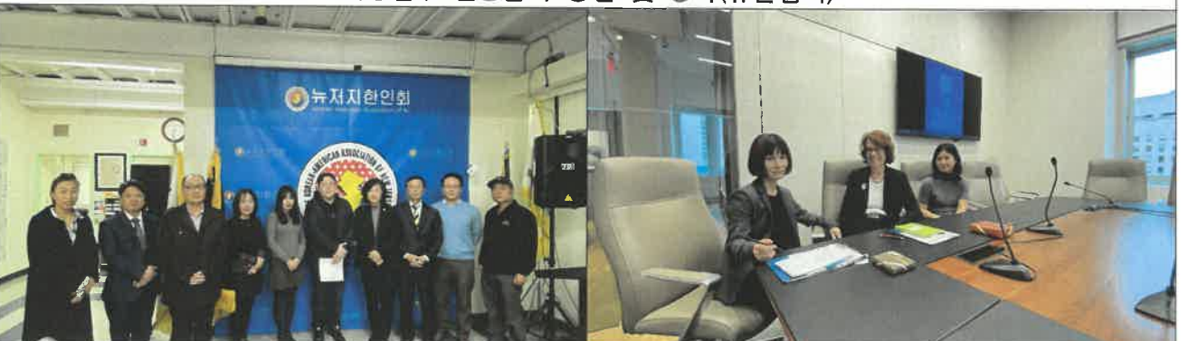
뉴저지주 한인회 업무협의