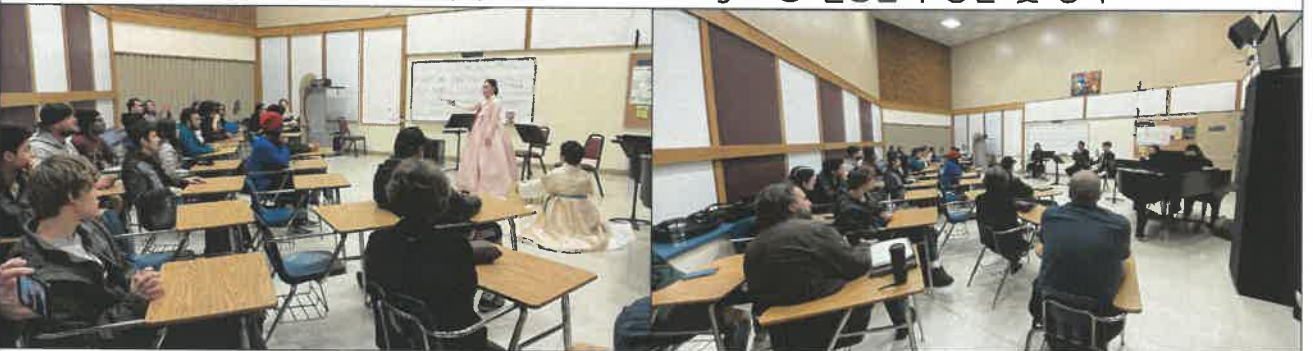
워싱턴주 전통음악 공연 및 강좌(레이크우드시)