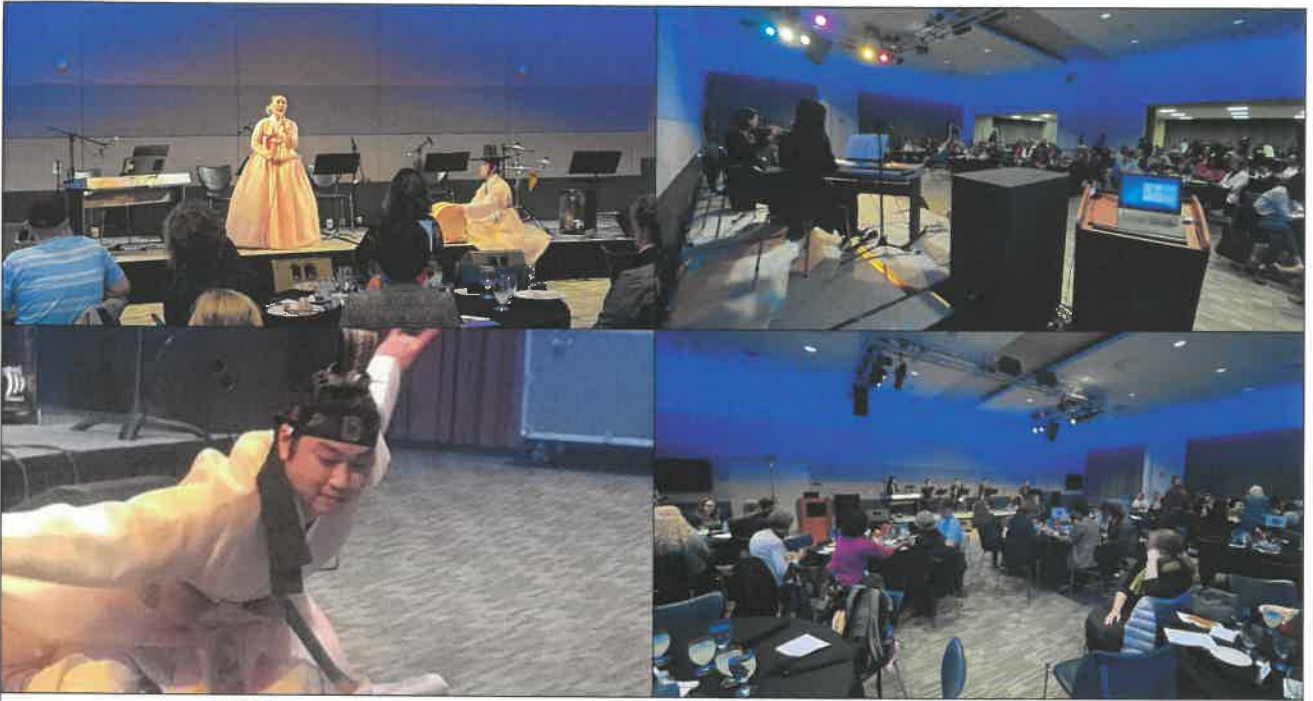
워싱턴주 피어스칼리지 International Night 중 전통음악 공연 및 강좌