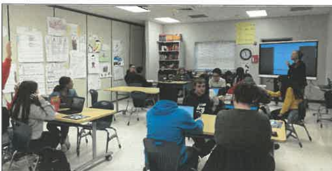
페더럴웨이 공립학교 업무협약 및 시찰