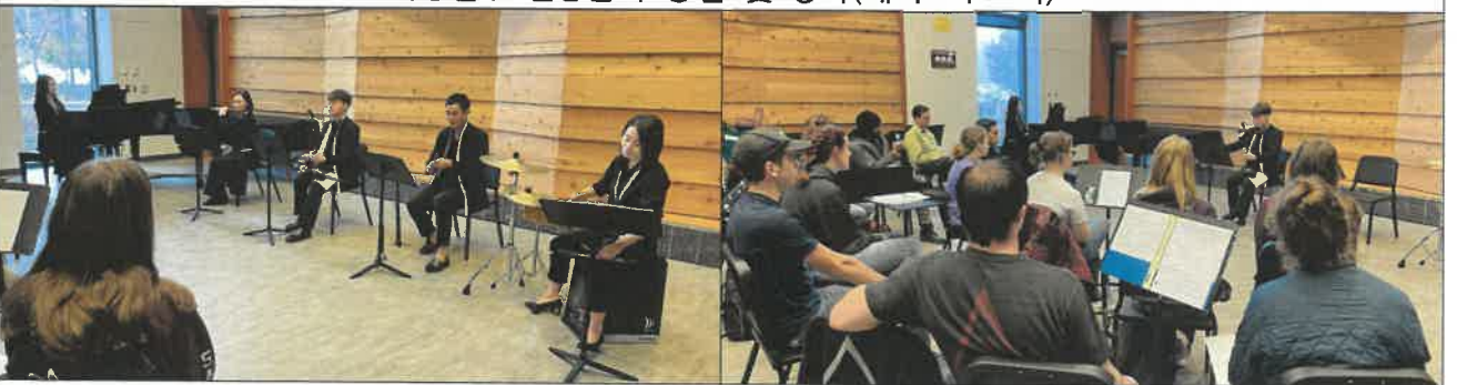
워싱턴주 전통음악 공연 및 강좌(퓨알럽시)