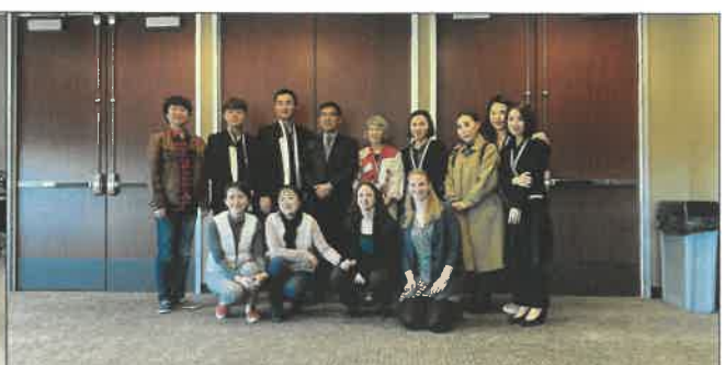
피어스칼리지 업무협약 체결협식